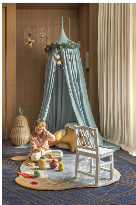
Little Guest promeut 320 hôtels dans le monde pensés pour les familles, tel que l'Hôtel Royal de l'Evian Resort.

Depuis 2018, Little Guest développe un réseau d'adresses en Europe et ailleurs. Boutique- hôtels, resorts , palaces..., tous répondent à des normes d'accueil strictes, facilitant le séjour des enfants de tout âge. Avant d'intégrer la collection, la start-up bruxelloise, dont 19% de la clientèle est Suisse, conseille et guide les hôteliers dans la scénarisation de l'accueil. Tout est scrupuleusement pensé pour mêler une approche haut de gamme et un programme spécifique (solution de garde, ateliers créatifs, activités sportives, etc.). En parallèle, le service Little Concierge accompagne gracieusement les clients dans l'organisation de leur séjour et envoie à chaque enfant, avant le départ, une valise Samsonite remplie de surprises: crème solaire bio, jeux de voyage, cartes postales à colorier, etc.