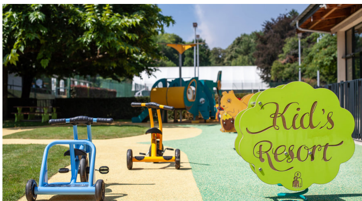
Point fort de l'Evian Resort, membre de la Little Guest Collection, le Kid's Resort prend en charge les enfants de tout âge.

Fondé par un entrepreneur belge devenu papa, le label Little Guest regroupe en Suisse et ailleurs 320 hôtels de standing où les enfants sont rois